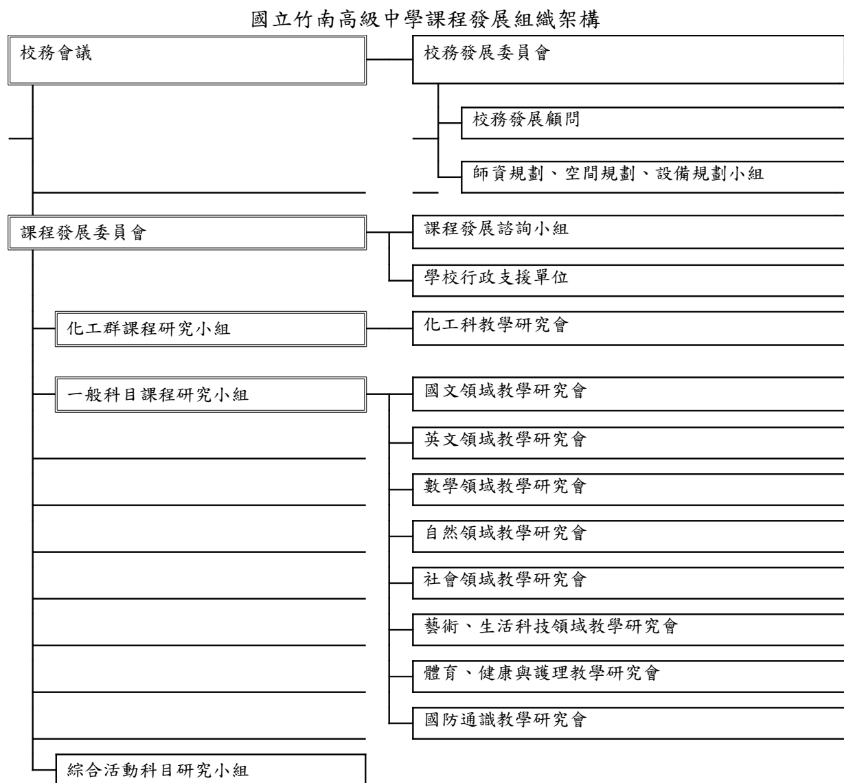
圖 1 課程發展組織架構圖