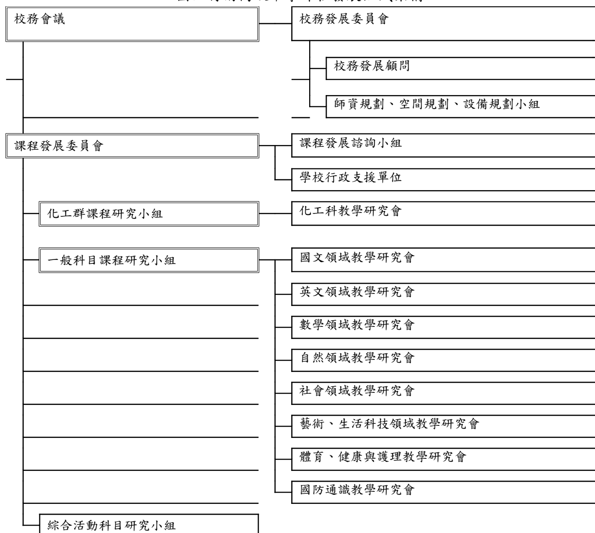
圖 1 課程發展組織架構圖